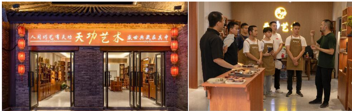
2023年木艺传承班学生参加天功艺术授课

基地与崇左天功艺术开展校企合作项目——“天功木艺”木艺技艺传承班。传承班给学校学生进行“木艺雕刻工艺”学习与培训。