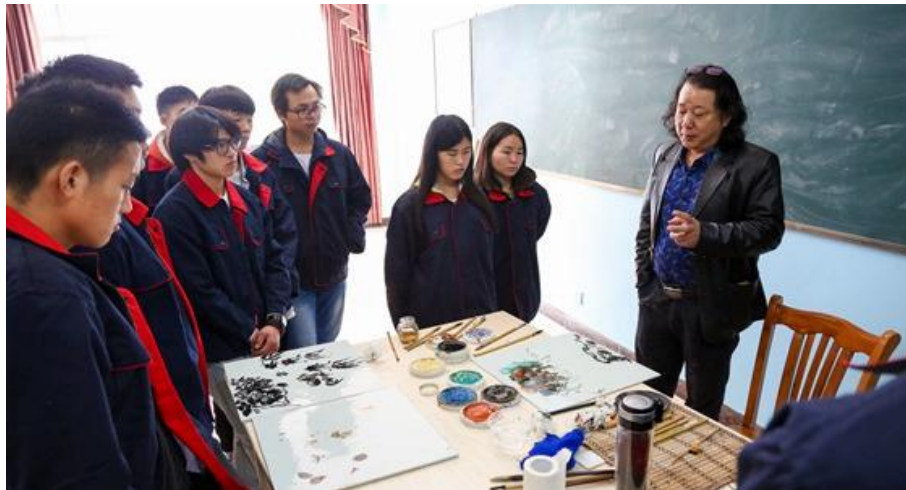
付老师陶瓷工艺现场教学