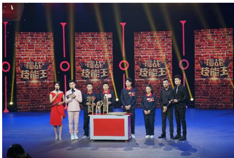
家具专业老师与学生参加广西首档大型青年职场挑战真人秀《挑战技能王》

节目将聚光点放到全区职业院校上，每场将邀请全区各职校优秀学生，与从业多年的技术能手进行同台竞技，并邀请全区各大企业代表来到现场，为优秀的职教学生提供就业机会。