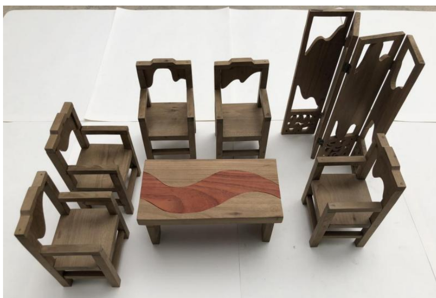
红木家具作品“一山一水又一城”