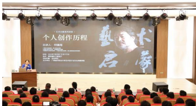
“艺术启蒙到艺术创作”讲座