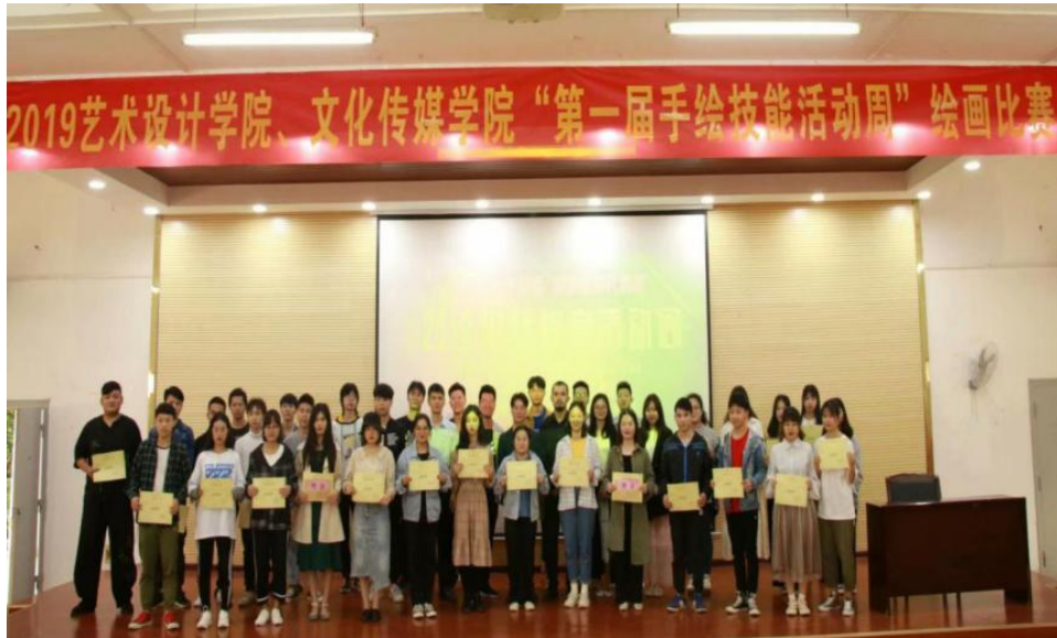
第一届手绘比赛活动

类专业技能赛项，深挖花山文化内涵，提高学生对当地民族文化的认识，培养学生的创新创业能力。