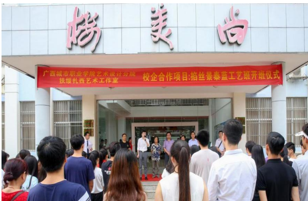
学生在制作“景泰蓝工艺”参加 2017 年广西工艺美术展现场制作

民族艺术（花山岩画）的传承与创新，是基地建设的重要目标，学校与民间企业、组织合作，逐步探索出了一条民族文化遗产发展之路。学校基地与扶绥扎西艺术工作室开展校企合作项目——“景泰蓝”工艺技艺传承班。传承班为当地农民工进行“景泰蓝插丝工艺”培训，目前累计培训 100 多名农民工，创造经济价值达 50 多万元。另外校内有 100 多名学生正在学习此项民族艺术工艺，延伸对花山文化的挖掘与创作，获得了社会的一致好评。