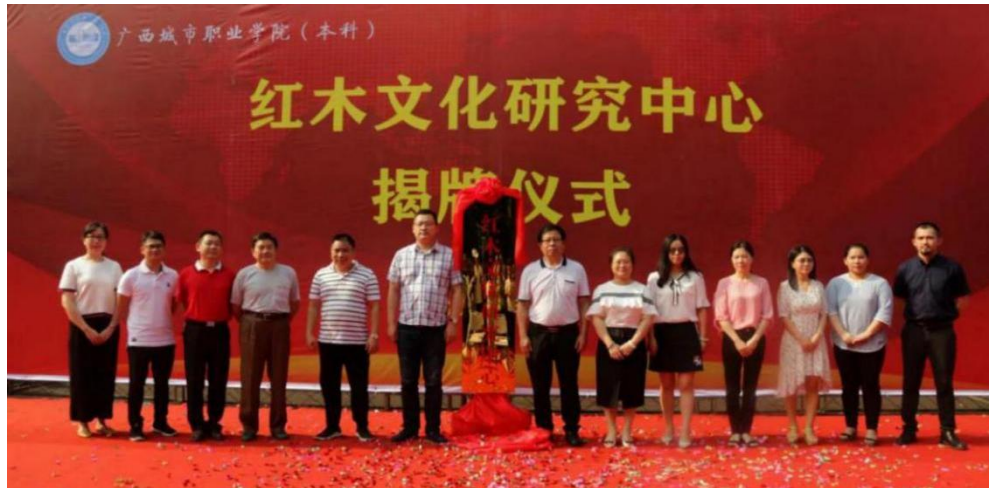
广西城市职业大学红木文化研究中心成立揭牌仪式现场