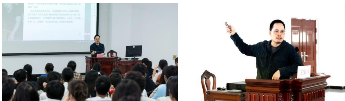
“艺术启蒙到艺术创作”讲座

2023年10月邀请到广西工艺美术大师王宝祥开展讲座。讲座中，王宝祥大师结合自己的代表作品《金蟾鸣春》《蟾戏瓜园》《吉祥三宝》对坭兴陶的历史、发展概况和陶瓷雕刻的概述及意义展开详细地介绍，并解析作品的制作方法和雕刻的表现形式，耐心地讲解陶艺工具的用法，强调重复多次练习的重要性，通过讲座，我校师生对广西本土民族文化有了更深入的了解。