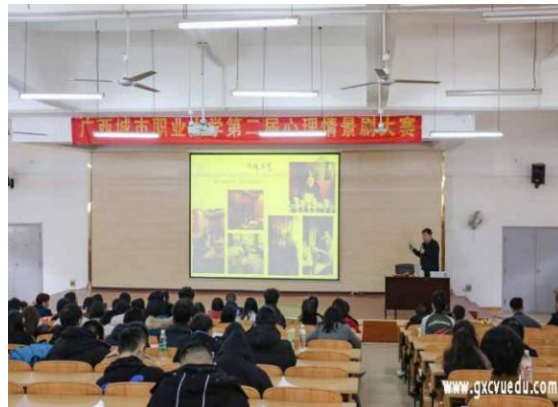
“葫芦文化与葫芦技艺”讲座现场