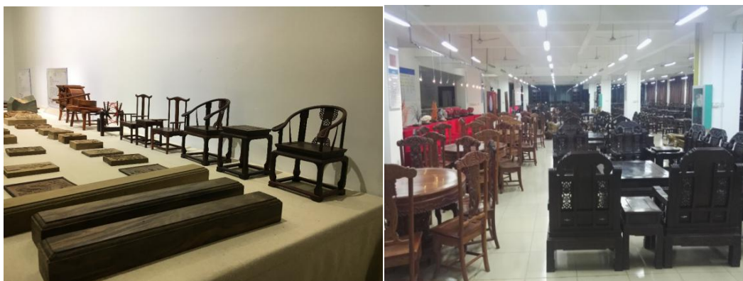
成品展示区学生作品展示